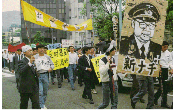
ဝိကင်းမြို့ကလူသတ်သမားအဖြစ်နာမည်ဆိုးနှင့်ကျော်ကြားခဲ့သူတရုတ်ကွန်မြူနစ်ပါတီရဲ့ဝန်ကြီးချုပ်လီပင်း၊ သူ့ရဲ့နောက်ဆုံးနေရက်တွေကပြည်သူလူထုရဲ့မုန်တီးစက်ဆုတ်မှုများထဲမှာ