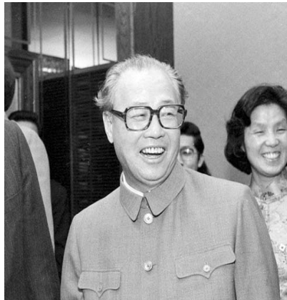
ကျောက်ကျီယန်ရဲ့နောက်မှာရပ်နေတဲ့ မရယ်မဲပြုံးပုဂ္ဂိုလ်က ဝမ်ကျားပေါင်ဖြစ်တယ်