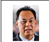
ထိုင်းနိုင်ငံခြားရေးဝန်ကြီး Kasit Piromya

ထိုင်းနိုင်ငံခြားရေးဝန်ကြီး ကာဆစ်ကလည်း မြန်မာနိုင်ငံကို ရောက်လာပြီး နအဖနဲ့ ဆွေးနွေး ပါတယ်။ ဒီနောက် တိုင်းရင်းသားလက်နက်ကိုင်တွေနဲ့ နအဖ ပြန်လည်သင့်မြတ်ရေးအတွက် ကြားဝင်ညှိနှိုင်းပေးမယ်လို့ ပြောလာပါတယ်။ တရုတ်နိုင်ငံ ကွန်မြူနစ်ပါတီ ဗဟိုကော်မတီ အမြဲတမ်းကော်မတီအဖွဲ့ဝင်ကလည်း နအဖကို လာတွေ့နေပါတယ်။